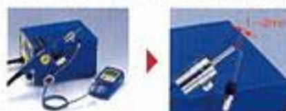
使用例2: FR-803B及FR-820 组合配合FG-100及热风温度探针