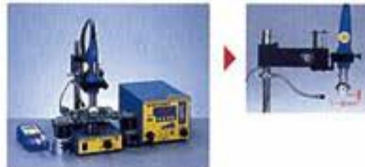
使用例3: FG-100 配合芯片温度探针