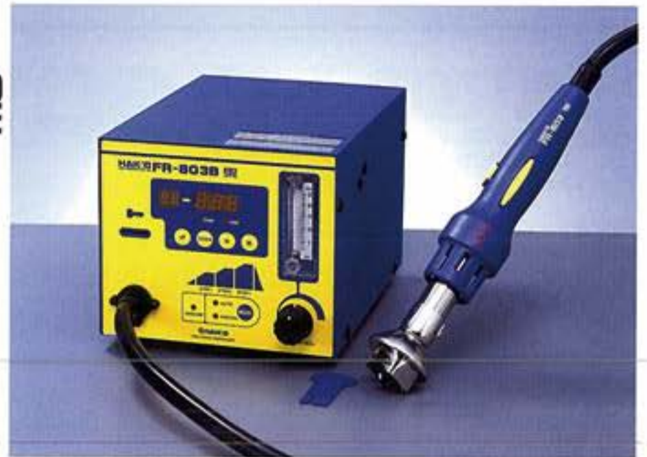
* 喷咀需另外购买，请参阅第22页