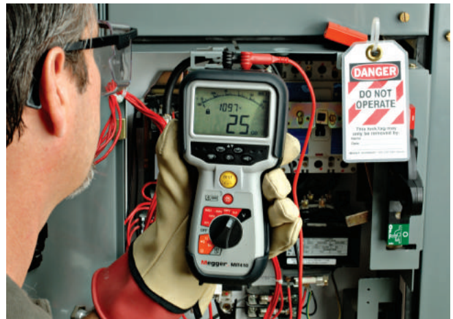
使用MIT400系列使配电板的测试更为快速、简单和安全。